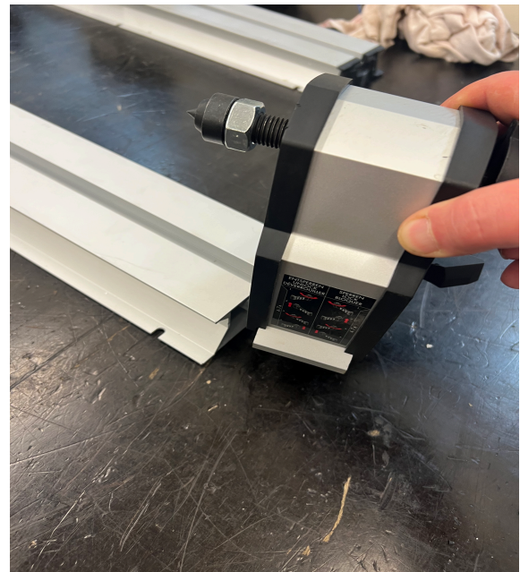
2. Reitstock entfernen / remove stock