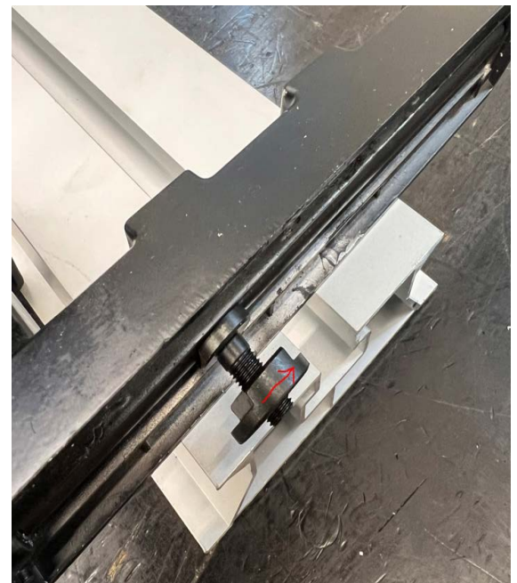
4. Klemmschraube 1 Umdrehung n. rechts clamping screw 1 turn to the right